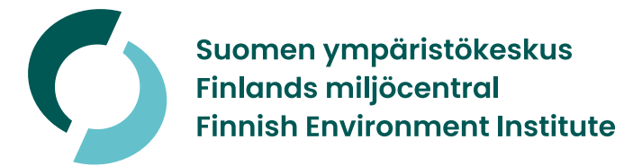
Tunnus valkoisella pohjalla

Yksiväristä valkoista ja mustaa tunnusta käytetään vain niissä tapauksissa, kun värillisen tunnuksen käyttö on mahdotonta.