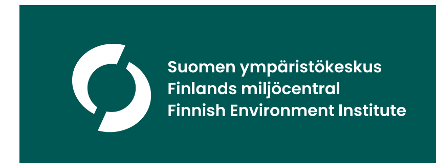
Tunnus tummalla väripohjalla