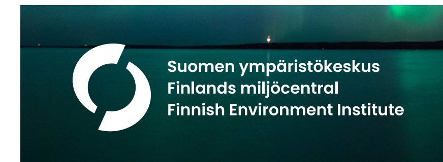
Tunnus tumman kuvan päällä