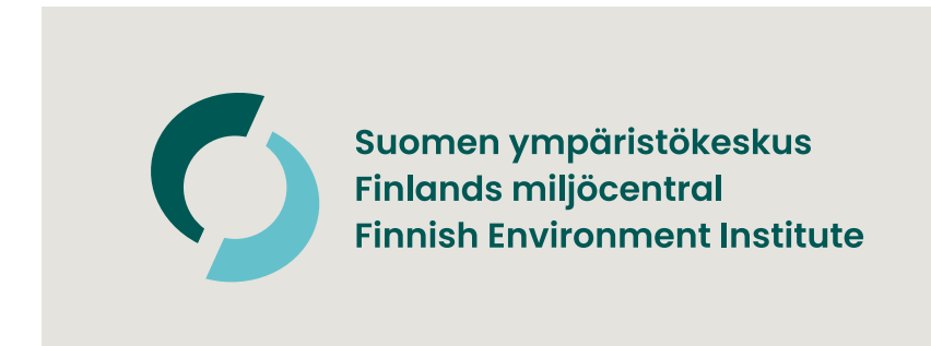
Tunnus vaalealla väripohjalla