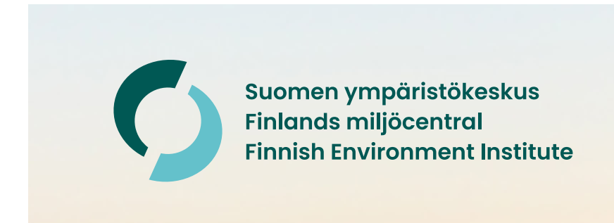
Tunnus vaalean kuvan päällä