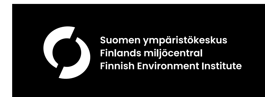
Valkoinen tunnus mustalla pohjalla