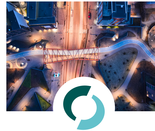
Suomen ympäristökeskus (Syke)